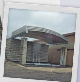
Port de Frouard (Nancy)