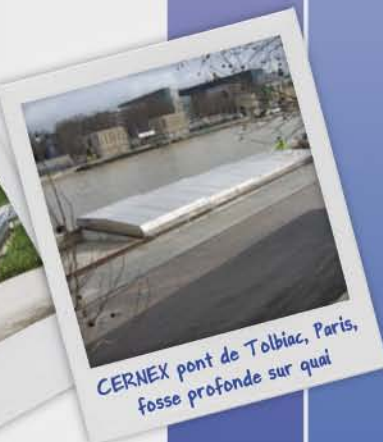
CERNEX pont de Tolbiac, Paris, fosse profonde sur quai

TOIT DÉCOUVRABLE • SARL Denis Oudin • 27 rue de l'Usine • 88220 RAON-AUX-BOIS Tél. 06 23 75 45 98 • Tél. 03 29 28 89 05 • Fax 03 29 62 60 25 contact@toit-decouvrable.com • www.toit-decouvrable.com