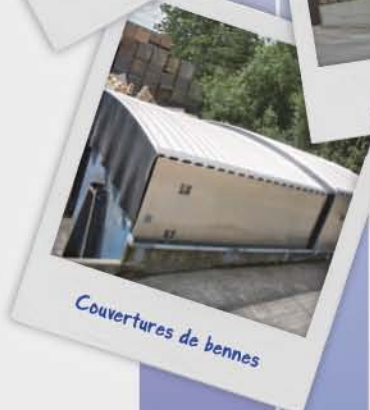
Couvertures de bennes