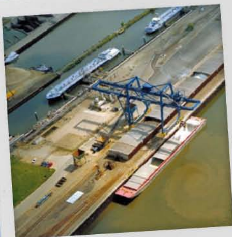
Applications en milieu portuaire

D'une conception simple mais robuste, le toit découvrable peut être manœuvré à la main depuis le sol ou une passerelle, avec un treuil rapide ou un moteur.