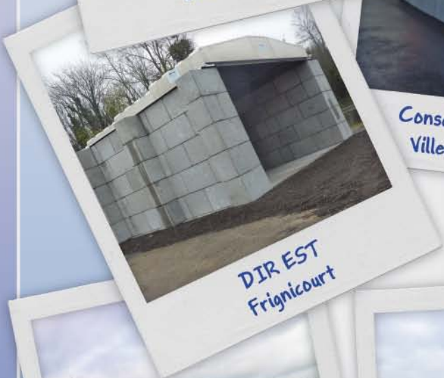
DIR EST Frignicourt