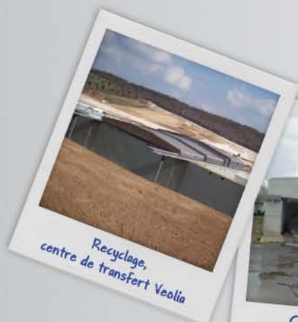
Recyclage, centre de transfert Veolia

Autres utilisations : coopératives céréalières, stockage de biomasse, d'enrobé à froid, etc.