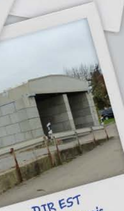
DIR EST Ligny-en-Barrois