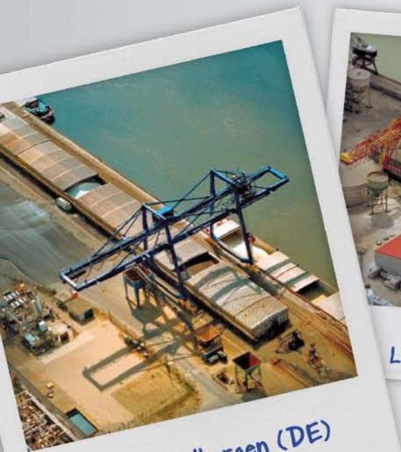
Port de Ladbergen (DE)

La manipulation se fait depuis la passerelle.