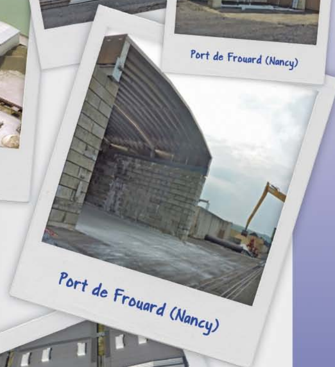
Port de Frouard (Nancy)