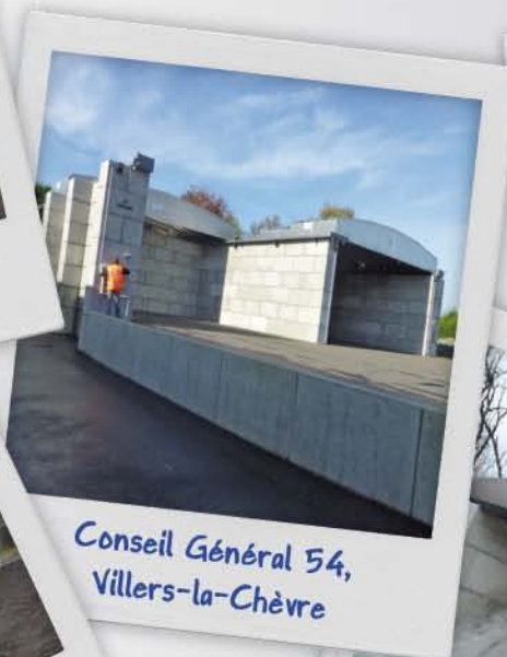
Conseil Général 54, Villers-la-Chèvre