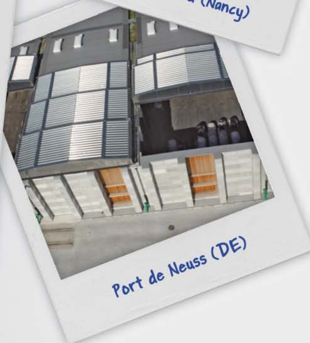
Port de Neuss (DE)

Les toitures peuvent être installées sur des murs fixes en béton banché, sur des murs modulaires en acier type LÜRA ou des blocs en béton assemblés à sec.