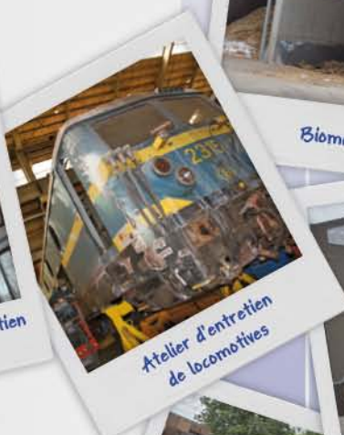
Atelier d'entretien de locomotives