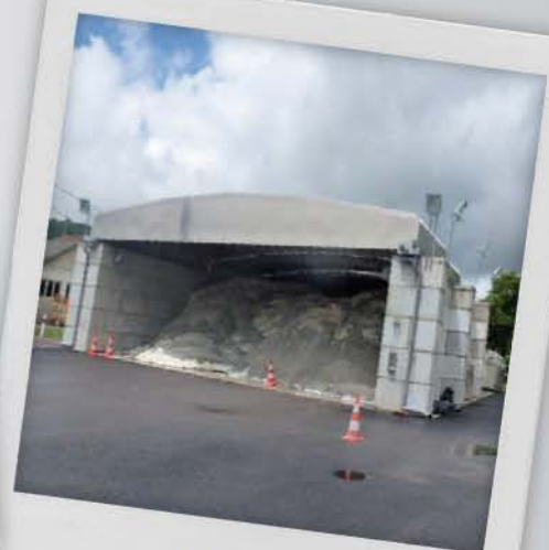
Abri à sel