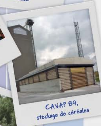
CAVAP B9, stockage de céréales