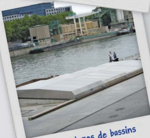
Couvertures de bassins et fosses