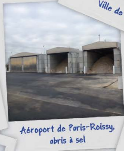
Aéroport de Paris-Roissy, abris à sel