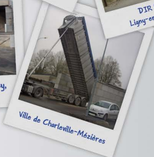
Ville de Charleville-Mézières