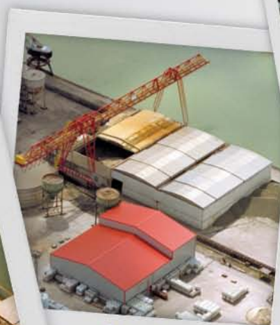
Port de Ladbergen (DE)