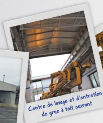
Centre de lavage et d'entretien de grue à toit ouvrant