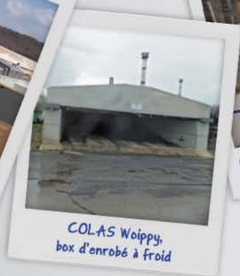
COLAS Woippy, box d'enrobé à froid